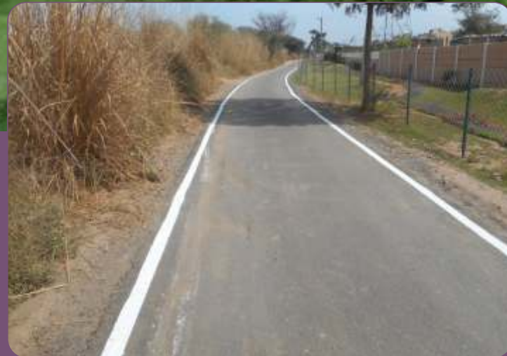
अब NH 8 सिर्फ़ 5 मिनट दूर