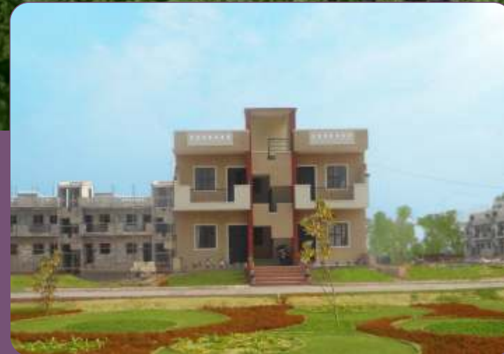
मॉडल घर तैयार