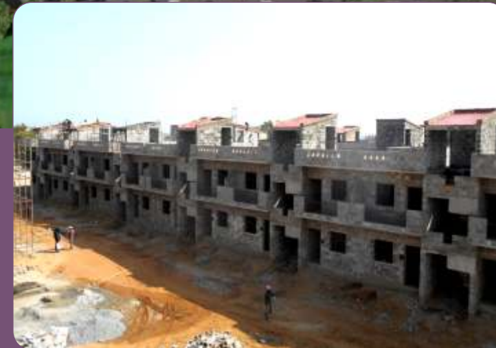
पोसेशन जुलाई 2016 में

बैंकों एवं गैर-बैंकिंग वित्तीय कंपनियों से आकर्षक होम लोन